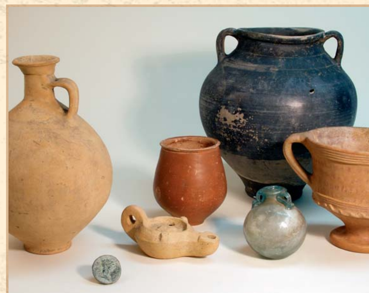
Begehrte Exportgüter bei den Germanen – Bronze- und Glasgefäße sowie Keramik aus den Provinzen des römischen Reiches.