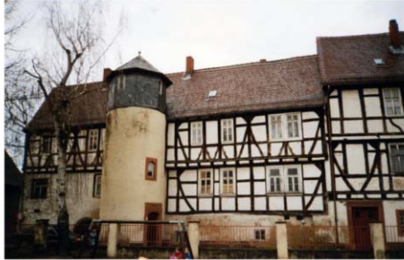
Schlösschen - Februar 2002

historischer Kernpunkt für die Bürgerinnen und Bürger und die Kinder geschaffen; ebenso mit der Restaurierung des Rückinger Schlösschens.